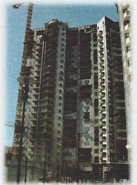
IV черга (секція 4)