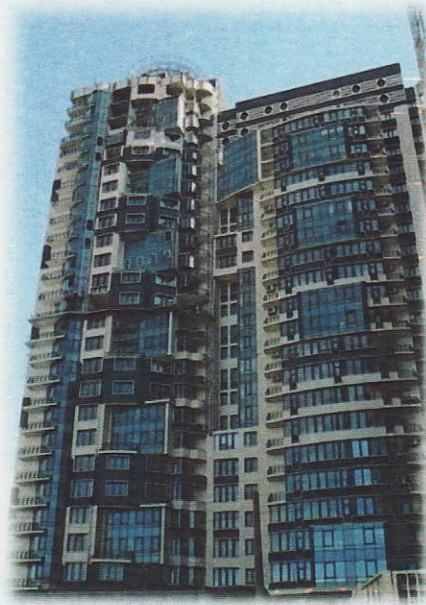
III черга (секції 1, 2)